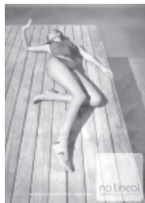
Concurso Publicidad para crecer Primer premio: Estefanía Giampieri

Concursos 1º cuatrimestre 2005 Páginas 6 y 7